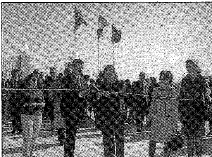
La inauguración del Instituto de Villarejo, es ya una realidad.

El viernes 7 de febrero, quedó inaugurado en Villarejo de Salvanés, el Instituto de Enseñanza Secundaria, que resuelve el problema de escolarización de 10 municipios del Sureste de Madrid.